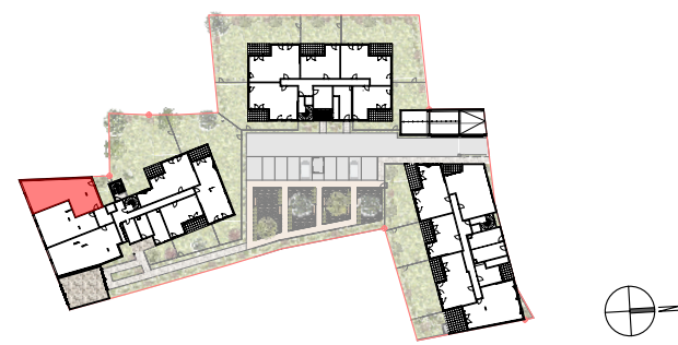
PLAN DE PRE-COM - REPERAGE

39-41 av Victor Hugo - 7717-7413F rue Colonel Parazols - 84110 VAISON-LA-ROMAINE